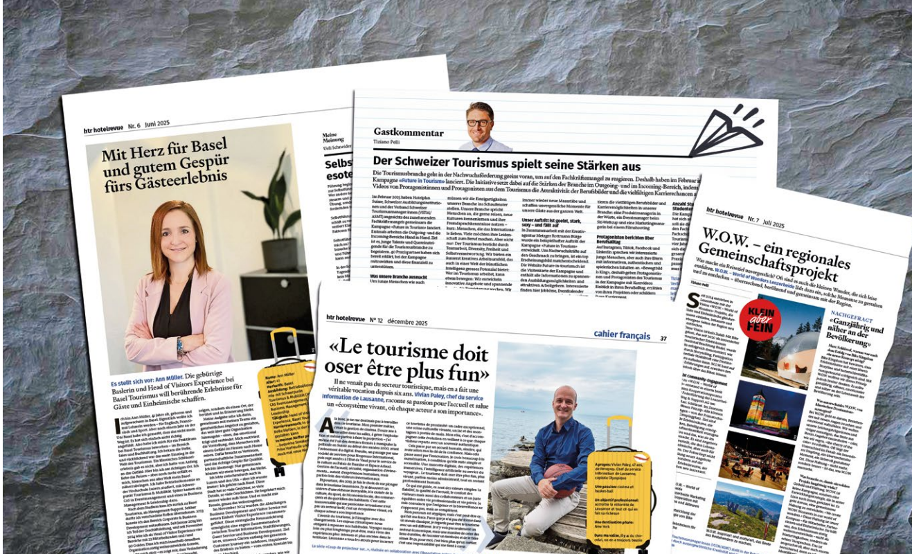
24 Artikel sind im Jahr 2025 in der HTR Hotel Revue erschienen

Durch die Community Plattform beUnity sind die Mitglieder digital optimal vernetzt. Die Plattform bietet vielerlei Möglichkeiten, die kontinuierlich genutzt werden.