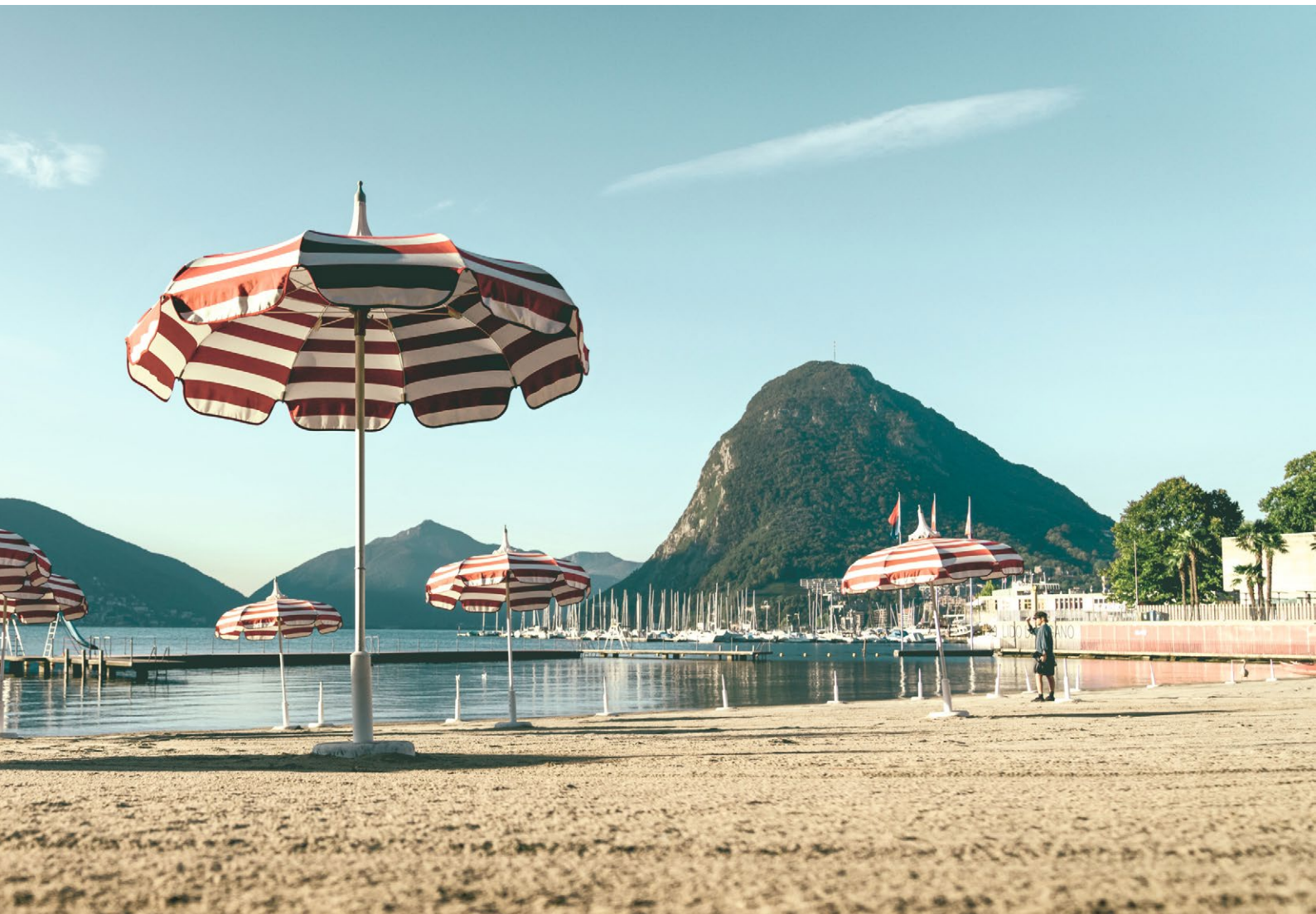
Lido in Lugano