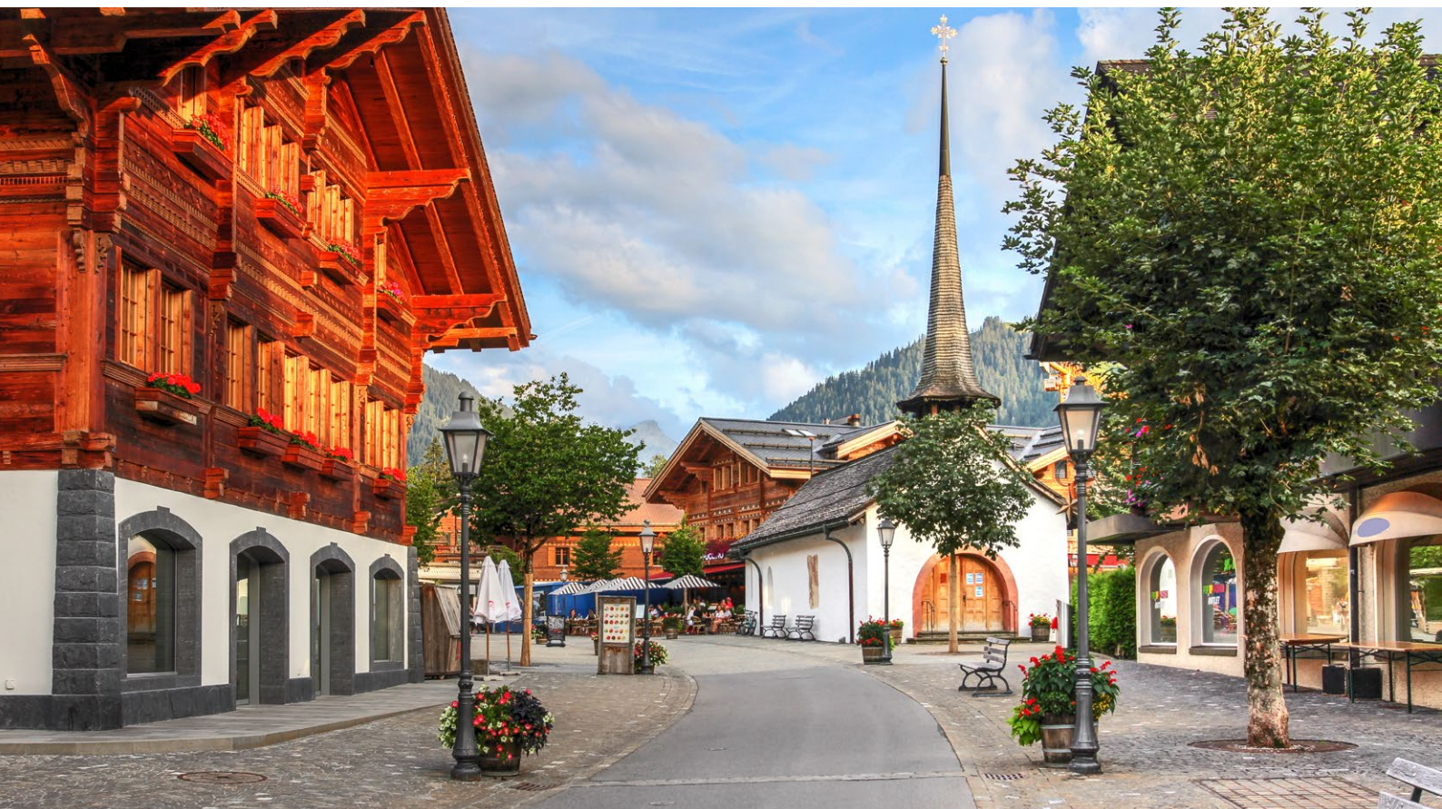
Die erste VSTM Masterclass lanciert unser Verband vom 1. bis 2. Juni 2026 in Gstaad

Die Lancierung des «Kompass Schnee» bietet den Destinationen die notwendige Entscheidungsgrundlage für eine prosperierende Zukunftsentwicklung. Destinationen können daraus ableitend ihre Anpassungsstrategien formulieren. Der VSTM ASMT unterstützt in der Aufarbeitung von Best Practices.