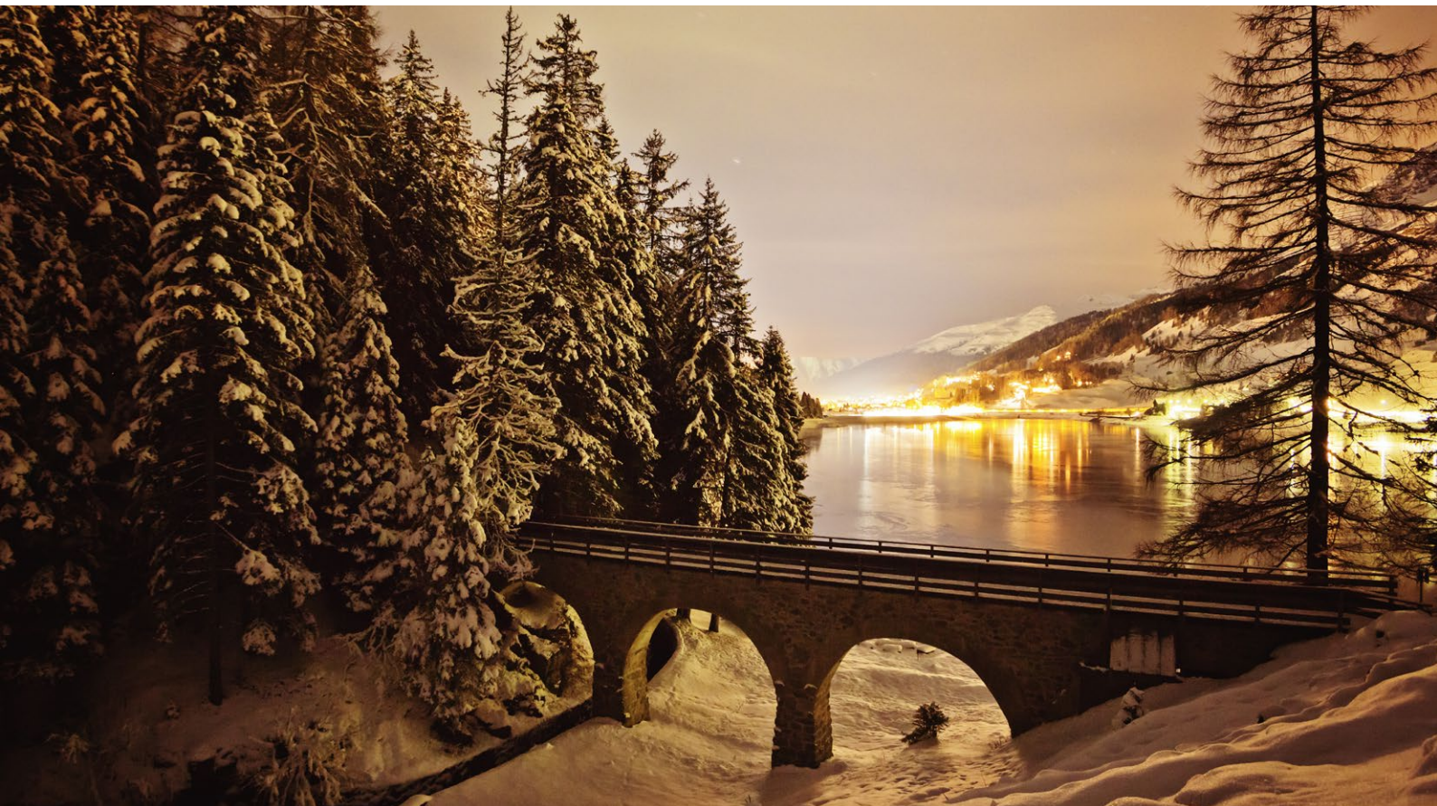
Das VSTM Managementseminar findet vom 3. bis 5. November 2026 in Davos statt

Ab 2026 zählt Swiss Post Advertising neu zu den Gold Partnern des VSTM ASMT. Als Kompetenzfeld der Schweizerischen Post verbinden die Werbeprofis physische und digitale Werbelösungen auf Basis von datenbasierten Kampagnenansätze. Mit aufmerksamkeitsstarken Werbekanälen von Mailings über Digital Out of Home bis hin zu Online- und E-Mail-Marketing sowie fundierter Datenkompetenz und dem Cross-Moments-Ansatz unterstützt Swiss Post Advertising Tourismusorganisationen bei der Erreichung Ihrer Marketingziele - wirkungsvoll, zielgerichtet und schweizweit, entlang der gesamten Customer Journey.